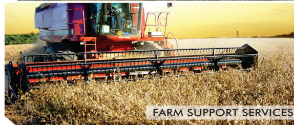
FARM SUPPORT SERVICES