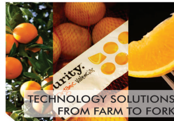
TECHNOLOGY SOLUTIONS FROM FARM TO FORK