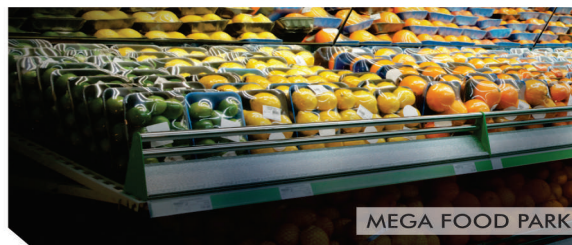
MEGA FOOD PARK