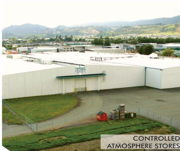
CONTROLLED ATMOSPHERE STORES