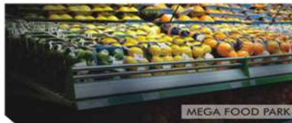
MEGA FOOD PARK