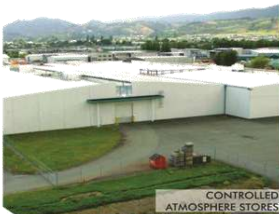
CONTROLLED ATMOSPHERE STORES