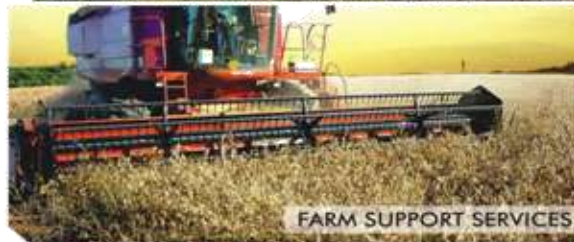
FARM SUPPORT SERVICES